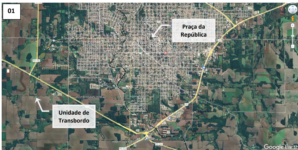
Imagem 01: Imagem de satélite indicando a localização da Unidade de Transbordo em relação a área central do município de Ijuí

4.2.3 Na Imagem 03 apresentamos foto aérea da Unidade de Transbordo com indicação das estruturas existentes.