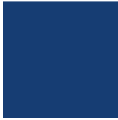
PANTONE Mazarine Blue 19-3864 TCX

Estampa Frente / Brasão Etiqueta corte especial laser, alta definição, termocolante 70x55mm. Estampa Costas Etiqueta corte especial laser, tafetá, termocolante 91x150mm. Estampa Pernas Etiqueta corte especial laser, tafetá, termocolante 50x82mm.