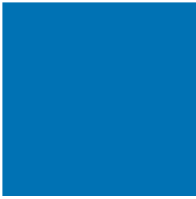
PANTONE Azul Francês 18-4140 TCX