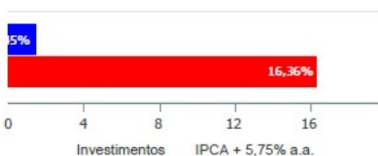
Investimentos x Meta de Rentabilidade

Por fim podemos concluir que mesmo com o resultado estando abaixo da meta atuarial a estratégia adotada foi a mais adequada para o exercício em questão, pois minimizamos as perdas como ocorreu em anos anteriores como em 2013, onde ocorreu o mesmo processo de elevação da taxa básica de juros e tiveram vários fundos que tiveram resultados negativos. A visão a longo prazo é o principal para a manutenção da saúde financeira do RPPS para cobrir suas obrigações futuras.