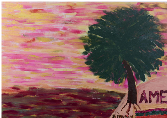
Pintado por Simoni Klassen.