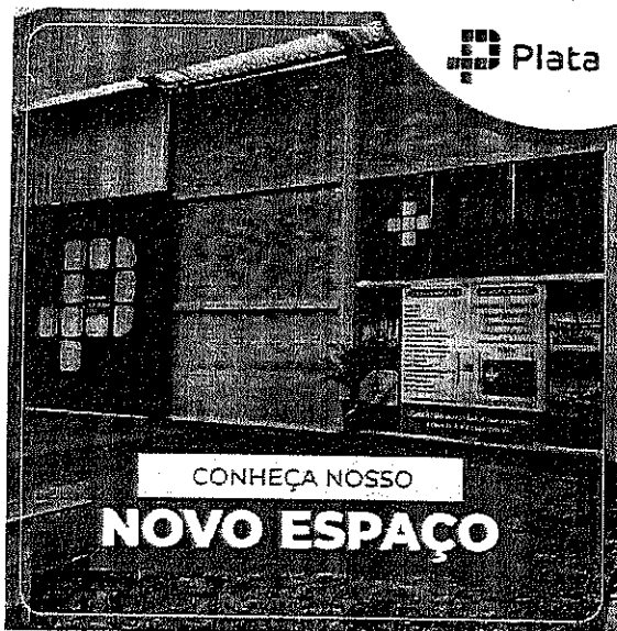
Fachada do prédio.

A seguir segue alguns registros fotográficos das instalações do Centro de Treinamentos e de cursos realizados: