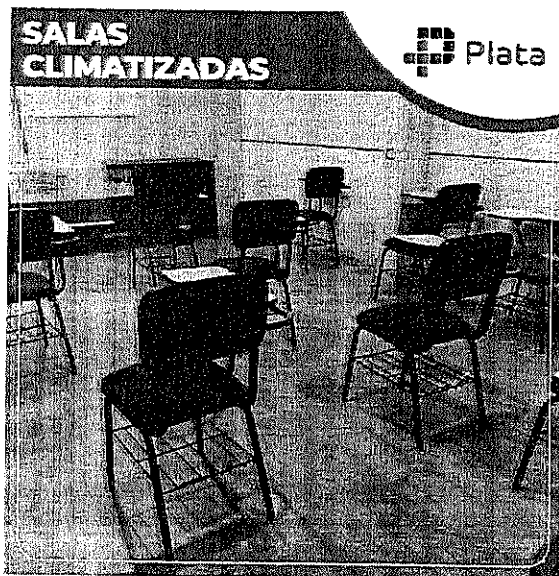
Salas de aulas climatizadas, com cadeiras estofadas e data show para melhor visualização das aulas teóricas.