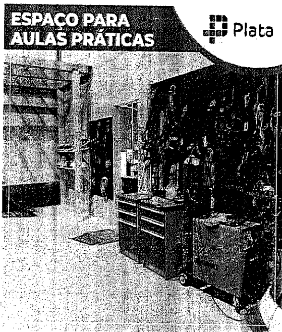
Espaço e materias utilizados nas aulas práticas.