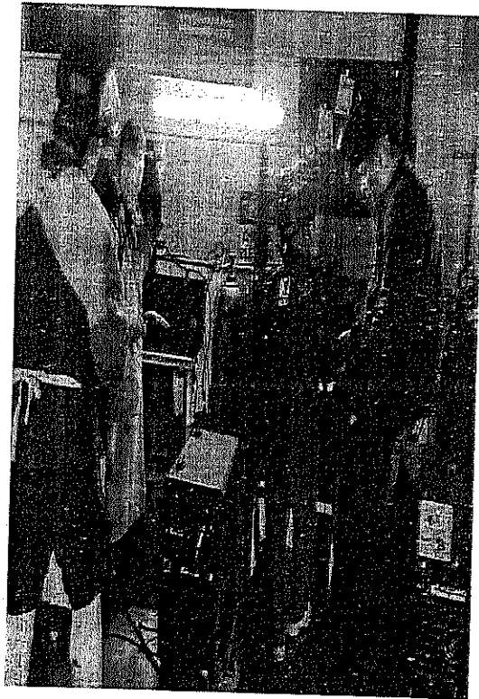
Materiais máquinas e equipamentos disponíveis para a realização das aulas práticas do curso de solda.