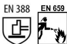
Figura ilustrativa 02

3.6 – A luva deverá possuir em sua grade os tamanhos 7, 8, 9, 10 e 11; a medida deverá ser feita seguindo o padrão internacional de medidas para luvas conforme figura ilustrativa 03