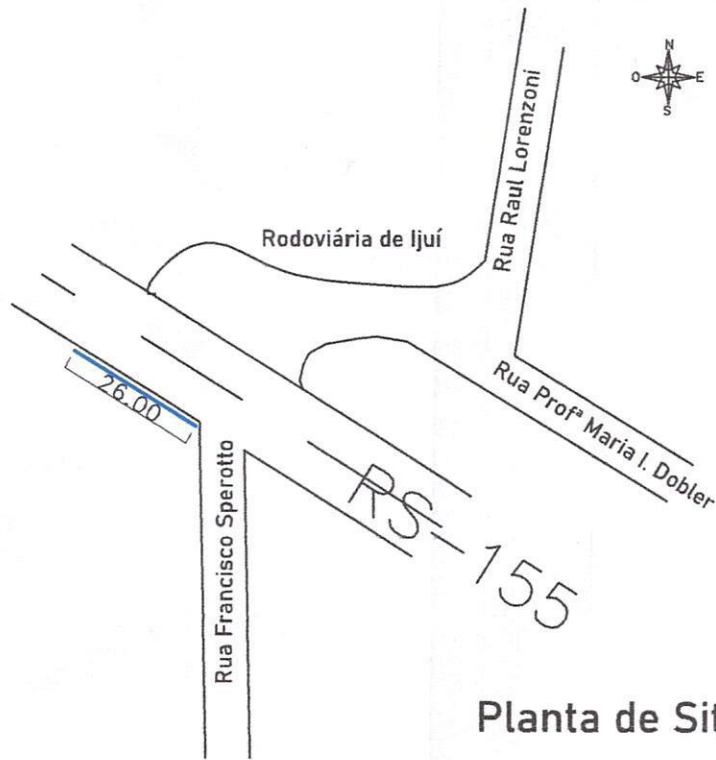
Planta de Situação