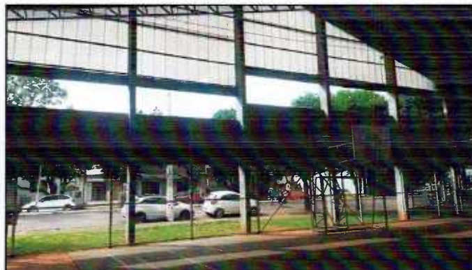
Figura 2: Vão inferiores – Frente Rua Emílio Glitz

3.3.2 Deverá ser executada alvenaria de tijolo furado, CLASSIFICADOS , à vista nas duas faces, largura da parede de 19cm, junta 1,2cm, no vão existente entre a escadaria que vai para o subsolo e a lateral do vestiário 1, bem como no buraco existente na parede Norte do piso superior entre a sala e a escada. AS FACES DOS TIJOLOS DEVERÃO SER PLANAS, COM ARESTAS VIVAS, SEM LASCAS E/OU FISSURAS. Todos os tijolos deverão ser do mesmo fabricante para não apresentarem variações de dimensões e de tonalidade.