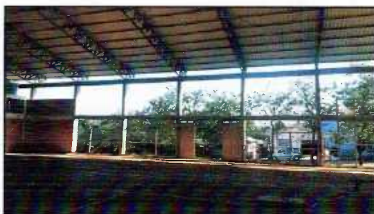
Figura 6: Viga superior para instalação dos refletores

3.4.1 - Deverá ser executada a instalação de 14 refletores, com lâmpada LED fechados longo alcance assimétricos, divididos em 2 linhas paralelas, na altura da viga superior lateral norte e sul do ginásio. A primeira linha de 7 refletores será instalada no lado Sul da quadra, aparente, na viga superior, com eletrodutos de aço galvanizado. Para a passagem do cabos, serão fixados com abraçadeiras e com a devida utilização caixas de passagens e tampas que se fizerem necessárias. A segunda linha de 7 refletores de será ser instalada na mesa altura da viga superior, porém no lado Norte da quadra. Para as novas instalações elétricas deverão ser instalados dois disjuntores específicos, no quadro existente, e a fiação será "puxada" de uma caixa de inspeção existente próxima a divisa sul do ginásio. As instalações serão com eletrodutos e conduletes aparentes, fixados nos pilares com abraçadeiras.