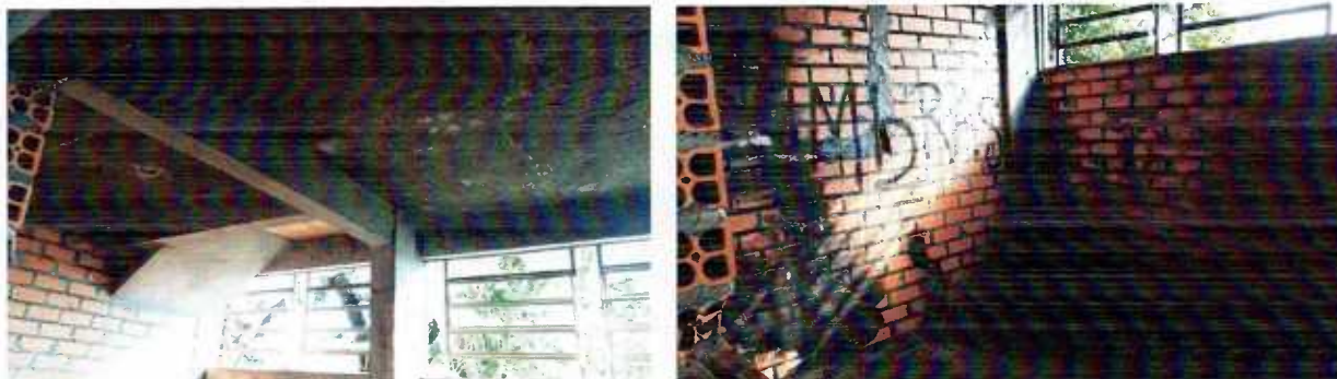
Figura 19 e 20: Paredes refeitórios a serem limpas e pintadas

3.9.1 – As paredes e teto do refeitório no primeiro piso deverão passar por limpeza rigorosa, pois receberão duas demãos de tinta látex acrílica em cor a ser definida.