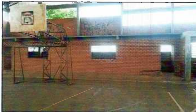
Figura 10: Vãos para instalação de portas e janelas em ferro

3.6.3 – Deverá ser reformada a grade metálica existente na área do banheiro/escada para piso inferior. Será executado um corte na grade e sua recolocação/chumbamento na lateral da porta de entrada, deixando livre o acesso para o banheiro e fechando a escada para o piso inferior.