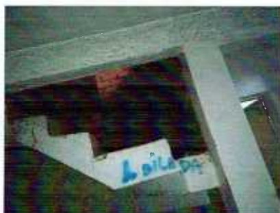
Figura 3: vão escada/vestiário

3.3.2 Deverá ser executada alvenaria de tijolo furado, CLASSIFICADOS , à vista nas duas faces, largura da parede de 19cm, junta 1,2cm, no vão existente entre a escadaria que vai para o subsolo e a lateral do vestiário 1, bem como no buraco existente na parede Norte do piso superior entre a sala e a escada. AS FACES DOS TIJOLOS DEVERÃO SER PLANAS, COM ARESTAS VIVAS, SEM LASCAS E/OU FISSURAS. Todos os tijolos deverão ser do mesmo fabricante para não apresentarem variações de dimensões e de tonalidade.