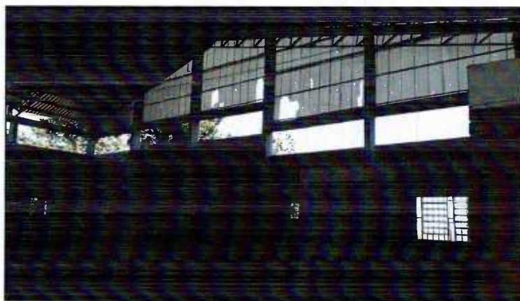
Figura 5: 2º piso – executar peitoril e fechamento oitões

3.3.9 – Fechamento com telha translúcida: Deverão ser retiradas as telhas quebradas/furadas e instaladas novas peças para o fechamento, inclusive nos vãos acima das alvenarias de tijolo á vista, nos dois oitões Leste-Oeste.