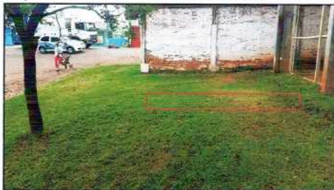
Figura 16: Local para execução da rampa

3.7.1 – Rampa de acesso: Deverá ser executada rampa de acesso, com comprimento de 4,5 metros e largura de 2,0 m e uma calçada de acesso, com 5 metros de comprimento por 1,5 metros de largura. A rampa terá inclinação máxima de 8,33% e deverá ser executada com lastro de brita, armação em ferro e concreto. Deverá ser executado corrimão com guarda corpo na rampa.