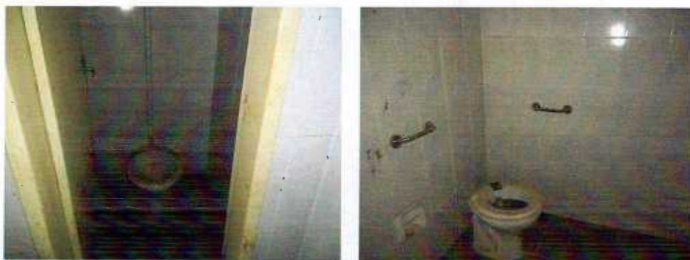
Figura 7 e 8: banheiro masculino

3.5.2 – Deverá ser substituída duas louças sanitárias que estão quebradas e 2 portas internas de giro semi ocas no banheiro masculino. No vestiário 1, deverá ser instalado lavatório completo com coluna e louça sanitária. Nos vestiários e banheiros serão instalados 7 novos sifões e 4 torneiras novas. Deverão ser revisadas e instaladas novas luminárias, lâmpadas, pontos de interruptores e tomadas.