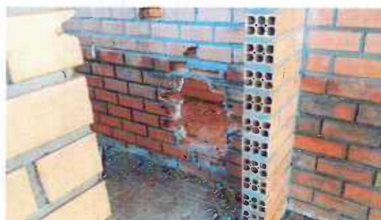
Figura 4: Buraco parede Norte

3.3.3 - Argamassa de assentamento: cimento, cal e areia, traço 1:2:8 (cimento, cal e areia).