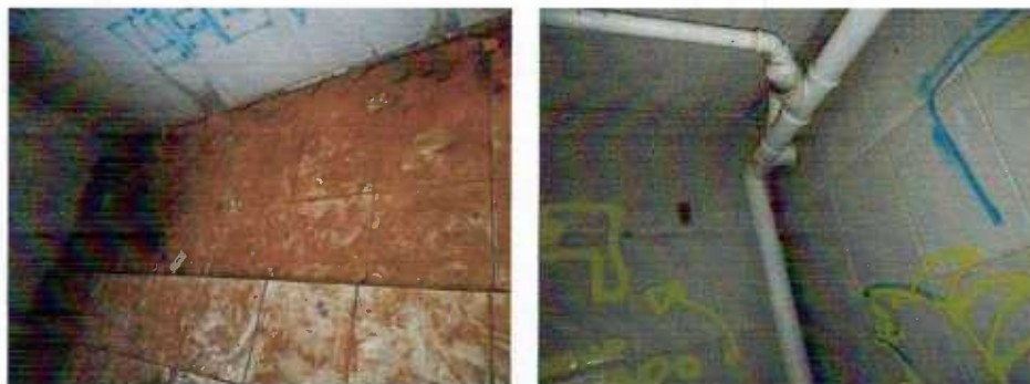
Figura 12 e 13: Vestiário 1

Vestiário 2 - deverá ser efetuada a limpeza e remoção de entulho, execução de piso cerâmico, instalação de 1 louça sanitária e 1 lavatório com coluna completo, no pequeno banheiro em anexo ao vestiário.