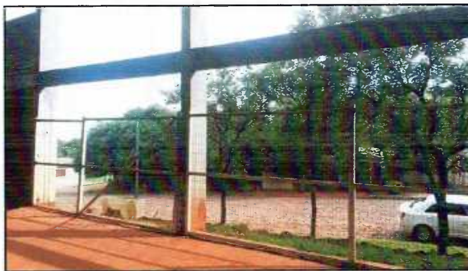
Figura 1: Peças metálicas nos vãos inferiores

3.2.1 - Deverão ser retiradas todas as grades e estruturas metálicas da parte inferior da quadra, com o devido cuidado pois estas serão reutilizadas na própria obra, porém na parte superior, para a vedação dos vãos entre as vigas e pilares.