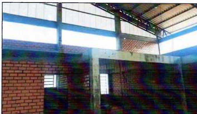
Figura 11: Reforma Grade metálica

3.6.3 – Deverá ser reformada a grade metálica existente na área do banheiro/escada para piso inferior. Será executado um corte na grade e sua recolocação/chumbamento na lateral da porta de entrada, deixando livre o acesso para o banheiro e fechando a escada para o piso inferior.