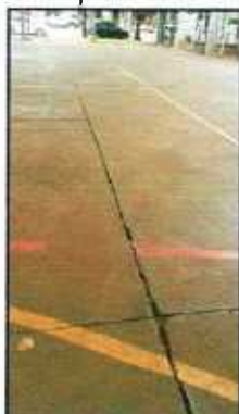
Figura 18: Juntas de dilatação deverão ser limpas e preenchidas

3.8.4 – Piso nivelado: Deverá ser executado concreto de nivelamento, entre a quadra esportiva e o piso ao redor.