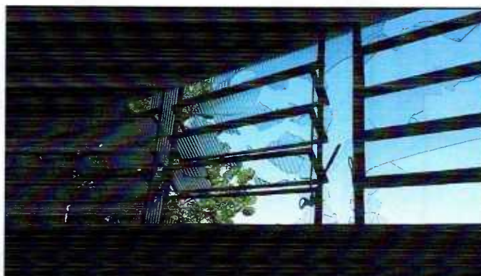
Figura 9: Troca de vidros danificados

3.6.3 – Deverão ser instalados em todas as janelas basculante novos vidros, lisos, espessura 4mm, com o devido acabamento em massa.