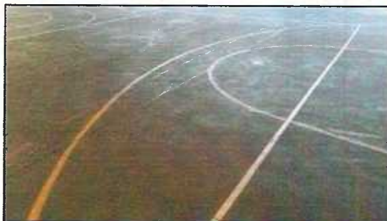
Figura 17: Linhas demarcatórias quadra - repintar

3.8.2 – Demarcação das quadras para prática de esportes: Deverá ser executada a repintura das linhas demarcatórias, com tinta especial para demarcação, para a identificação dos diferentes esportes a serem praticados no local.