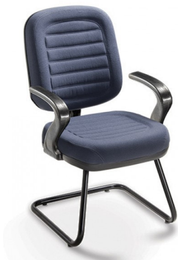
Imagem de referência para aspecto geral da cadeira e desenho das costuras

Profundidade da Superfície do Assento: 465 mm Largura do Assento: 485 mm Altura do Assento: 460 mm