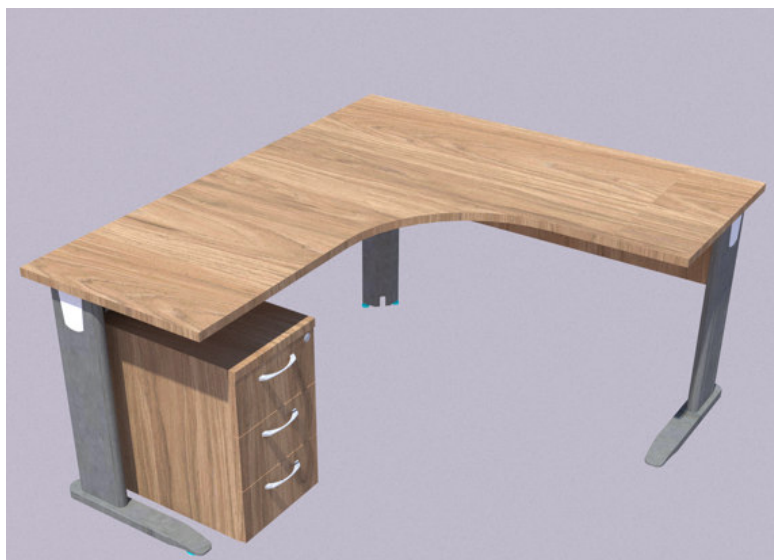
Imagem 1: Aspecto da Mesa angular em "L" com gaveteiro