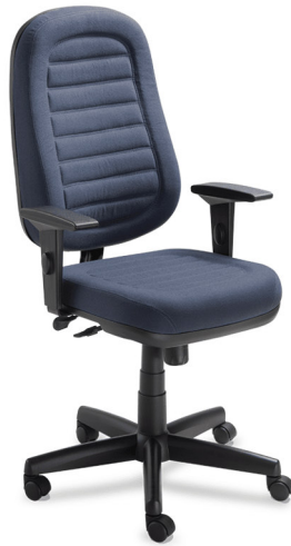
Imagem de referência para aspecto geral da cadeira e desenho das costuras