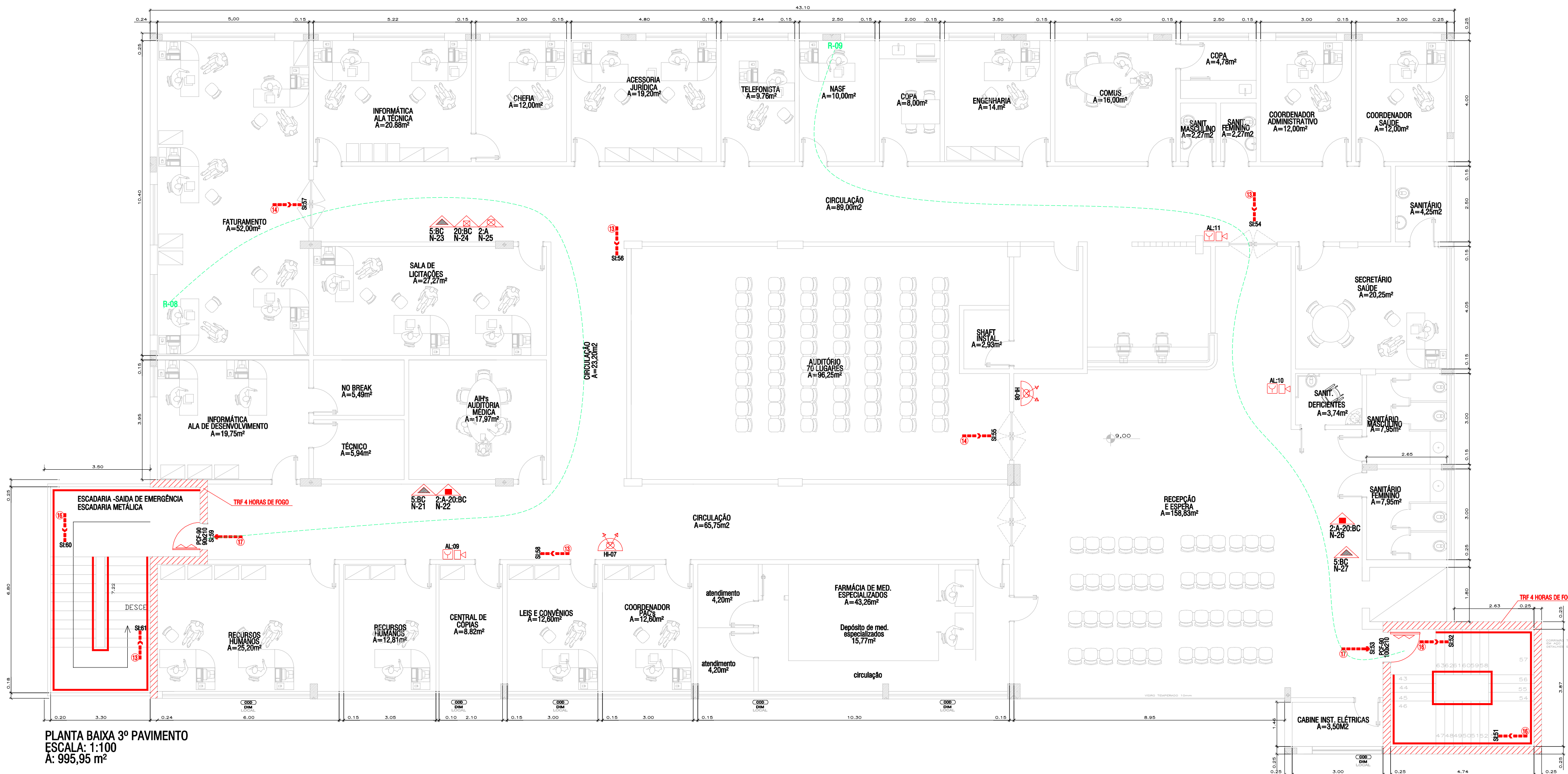
PLANTA BAIXA 3º PAVIMENTO ESCALA: 1:100 A: 995,95 m²

NOTAS GERAIS: - Os padrões das sinalizações devem atender o previsto na NBR-13434-2/2004.